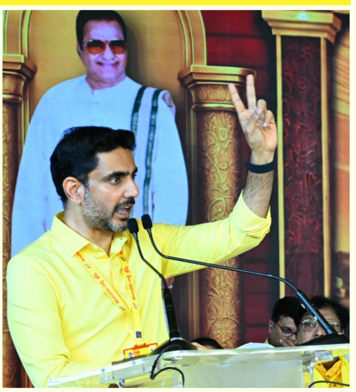
వివరాలు 2వ పేజీలో

“వర్షవల్ మహానాడులో జోషీ తగ్గలేదు” -- 7.5 లక్షల మంది పాల్గొన్న తొలి రోజు మహానాడు 1,875 క్లస్టర్ నుంచి కార్యకర్తల భారీ సందన “పసుపు జెండా తెలుగు వారి ఆత్మగౌరవం” స్థానిక ఎన్నికలకు సిద్ధం కావాలని పార్టీ శ్రేణులకు పిలుపు “గొడ్డలి పార్టీకి గోల్ లేదు... అధిక అడ్డగోల్ బ్యాచ్” అంటూ సీఎం పంచ్ డైలాగ్స్