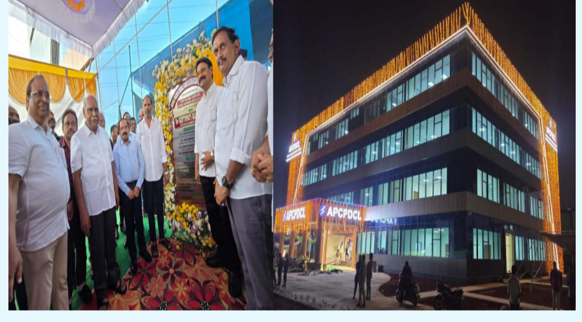
అమరావతి రక్షణ స్కూల్

అమరావతిలో ఆంధ్రప్రదేశ్ సెంట్రల్ పవర్ డిస్ట్రిబ్యూషన్ కంపెనీ లిమిటెడ్ (ఏపీసీపీడీసీఎల్) నూతన కార్పొరేట్ కార్యాలయాన్ని రాష్ట్ర విద్యుత్ శాఖ మంత్రి గొట్టిపాటి రవికుమార్ ప్రారంభించారు. సుమారు రూ. 30 కోట్ల వ్యయంతో నిర్మించిన ఈ కార్యాలయం విద్యుత్ శాఖ పరిపాలనా వ్యవస్థకు మరింత బలం చేకూర్చునుందని మంత్రి తెలిపారు.