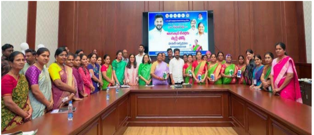
ఉండటానికి వీల్లేదని, సొంత భవనాలు నిర్మించేందుకు అవసరమైన ప్రణాళికలు రూపొందించాలని అధికారులకు సీఎం స్పష్టం చేశారు. ఆరోగ్యలోపు పిల్లలకు పౌష్టికాహారం అందించే వారిలో మానసిక ఎదుగుదల ఉంటుందని, పౌష్టికాహారం లేకపోవడం వల్లే ఎక్కువ సమస్యలు వస్తున్నాయని తెలిపారు. భవిష్యత్లో అవే అనారోగ్య సమస్యలకు దారి తీస్తున్నాయని అన్నారు. అలాంటి పరిస్థితులు రాకుండా ఉండేందుకే తెలంగాణ రాష్ట్ర ప్రభుత్వం ఇలాంటి పథకాలను ప్రవేశపెట్టిందని వివరించారు. "దేశంలో ప్రస్తుతం ఫుడ్ సెక్యూరిటీ ఉంది. కానీ