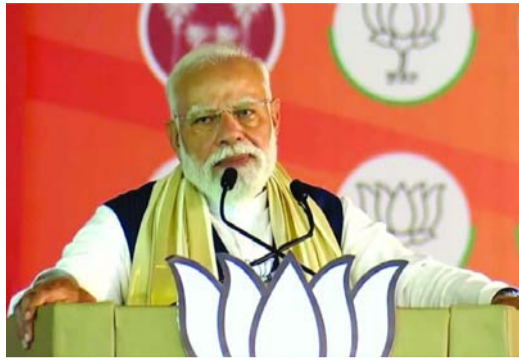
ప్రభుత్వ నిష్ఠుమణకు కొంటోడోన్ ప్రారంభమైంది. కేరళలో మొదటిసారిగా బీజేపీ-ఎన్డీఏ ప్రభుత్వం అధికారంలోకి రాబోతోంది.

కేరళలో ఎల్డీఎఫ్ ప్రభుత్వ నిష్ఠుమణకు కొంటోడోన్ ప్రారంభమైందని ప్రధాని నరేంద్ర మోదీ అన్నారు. ఎన్నికల తర్వాత కేరళలో అతిపెద్ద మార్పు జరుగుతుందని, బీజేపీ నేతృత్వంలోని ఎన్డీఏ అధికారంలోకి వస్తుందని ధీమా వ్యక్తం చేశారు. కేరళ అసెంబ్లీ ఎన్నికల ప్రచారంలో భాగంగా పతనంపట్ట జిల్లాలోని తిరువళ్లూర్ నిర్వహించిన బహిరంగ సభలో ప్రధాని మాట్లాడారు. కేరళ అభివృద్ధికి అవినీతి, మతతత్వం రెండు అతిపెద్ద అవరోధాలని ఈ సందర్భంగా చెప్పారు. శబరి రైలు ప్రాజెక్టును ఎల్డీఎఫ్ ప్రభుత్వం అలస్యం చేయడంతో తిరువళ్లూర్ ప్రజలు తీవ్రంగా నష్టపోయారని ప్రధాని ఆరోపించారు. కేరళకు అపారమైన సామర్థ్యం ఉన్నప్పటికీ, అభివృద్ధి పరుగులో ఇతర రాష్ట్రాల కంటే వెనుకబడి ఉందని పేర్కొన్నారు. ఎల్డీఎఫ్, యూడీఎఫ్ ప్రభుత్వాల సరైన క్రమ చూపకపోవడం వల్ల కేరళ గ్రామీణ ప్రాంతాల్లో మౌలిక సదుపాయాలు అధ్వాన్నంగా ఉన్నాయని మోదీ ఆరోపించారు. కేరళలో బీజేపీ దబల్ ఇంజన్ ప్రభుత్వం అధికారంలోకి వస్తే అన్ని అడ్డంకులు తొలగిపోతాయని చెప్పారు. పశ్చిమాసియాలో పరిస్థితిపై కాంగ్రెస్ అనవసర ఆందోళనలు రేకెత్తిస్తోందని ప్రధాని విమర్శించారు. కాంగ్రెస్ నేతృత్వంలోని యూపీఏ ప్రభుత్వం కంటే ఎన్డీఏ ప్రభుత్వం కేరళ అభివృద్ధి కోసం బదు రెట్లు అధికంగా నిధులు ఖర్చు చేసిందని వివరించారు. “నేను ఇంతకు ముందు కూడా ఇక్కడికి వచ్చాను. కానీ ఈసారి మార్పు గాలులు మరో దిశలో వీస్తున్నాయి. కేరళ ప్రజల మూడే మారింట్లు కనిపిస్తోంది. కేరళలో అతిపెద్ద మార్పు జరగబోతోంది. ఏప్రిల్ 9న పోలింగ్ జరుగుతుంది. మే 4న దశాబ్దాల దుస్థితిపాలన అంతం కానుంది. ఎల్డీఎఫ్