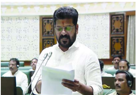
విధివిధానాలను, కార్యాచరణను ముందుకు తీసుకువెళ్లాలి అంటే ఫేజ్-1ను రాష్ట్ర ప్రభుత్వం స్వాధీనం చేసుకోవాల్సి పరిస్థితులు ఉత్పన్నం అయ్యాయి. అందుకోసం మెట్రో-1 ఎల్ఎస్ డీ రాష్ట్ర ప్రభుత్వం స్వాధీనం చేసుకోవటానికి అవసరమైన తీర్మానాన్ని సభలో ప్రవేశపెట్టారు.

హైదరాబాద్ మెట్రోరైలును ప్రభుత్వం తీసుకునేందుకు ఉద్దేశించిన తీర్మానాన్ని శాసన సభ ఆమోదించింది. ఈ మేరకు ముఖ్యమంత్రి రేవంత్ రెడ్డి ప్రవేశపెట్టిన తీర్మానానికి సభ ఆమోదం తెలిపింది. హైదరాబాద్ మెట్రో విస్తరణకు ఉన్న అడ్డంకులు తొలగించేందుకు ప్రభుత్వం మెట్రోరైలు స్వాధీనం చేసుకోవాలనే నిర్ణయానికి వచ్చినట్లు తీర్మానం వెల్లడిన తర్వాత వివరించారు. ప్రజా ప్రయోజనాల దృష్ట్యా మెట్రో విస్తరణకు ప్రభుత్వం నిర్ణయం తీసుకుందని సీఎం రేవంత్ రెడ్డి తెలిపారు. మెట్రో విస్తరణకు ఉన్న అడ్డంకులపై సమీక్షించామని అన్నారు. ప్రస్తుతం 69 కి.మీ. మెట్రో నిర్మాణం జరిగిందని చెప్పారు. మెట్రో ఫేజ్-2వీ కింద 76.4 కి.మీ, మెట్రో ఫేజ్-2వీ కింద 86.1 కి.మీ మేర నిర్మాణం కోసం కేంద్రానికి ప్రతిపాదనలు పంపామని వెల్లడించారు. మెట్రో విస్తరణపై సీఎం ఆసెంబ్లీలో ప్రసంగించారు. "మెట్రో విస్తరణ జరగాలంటే కేంద్ర ప్రభుత్వం, రాష్ట్ర ప్రభుత్వం కలిసి విస్తరించాలి. విస్తరణకు అవసరమైన